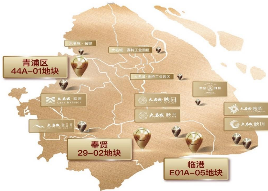
（图：大名城上海项目）

公司业务布局紧扣城市发展脉络。在《上海市城市总体规划（2017-2035 年）》中，对嘉定、松江、青浦、奉贤、南汇等 5 个新城，要求建设成为长三角城市群中具有辐射带动作用的综合性节点城市。就城市功能来看，五大新城不是简单承接中心城人口和功能疏解，而是按照集聚百万人口规模、形成独立综合功能的要求，打造“长三角城市网络中的综合性节点城市”，至 2025 年，五大新城将基本形成独立的城市场功能，在长三角城市网络中初步具备综合性节点城市的地位。五大新城常住人口总规模达到 360 万左右，新城所在区的 GDP 总量达到 1.1 万亿元。